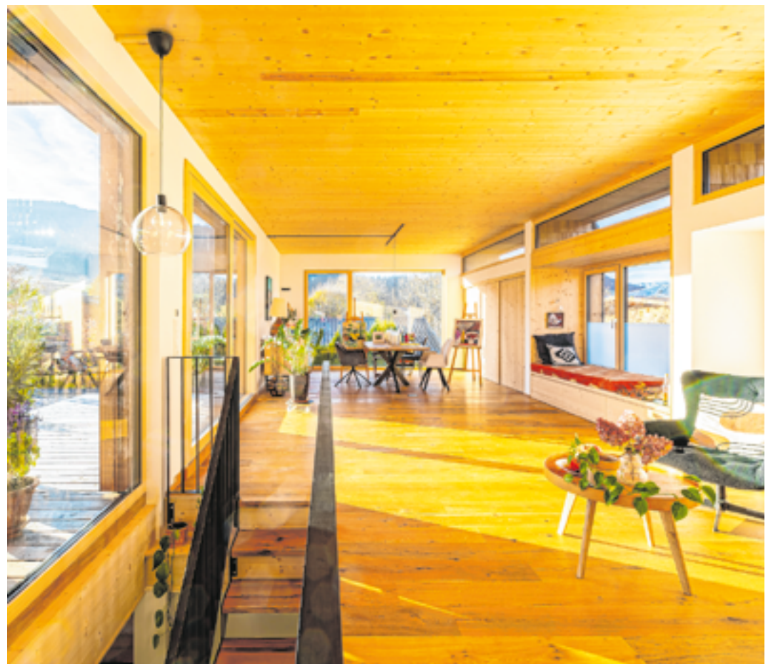
Durch die Aufstockung entstand ein lichtdurchflutetes, wohnliches Atelier samt Terrasse.

Die zwei Bauteile aus unterschiedlichen Jahrzehnten greifen gekonnt ineinander und schaffen auch im Außenbereich durch diverse Rück- bzw. Vorsprünge schöne, geschützte Plätzchen zum Verweilen. Auf dem Flachdach wurde eine PV-Anlage installiert, welche die Wärmpumpe bei der Energieerzeugung unterstützt. Das obere Geschoß muss dank seiner sonnigen Lage und der effizienten Holzbauweise kaum beheizt werden.