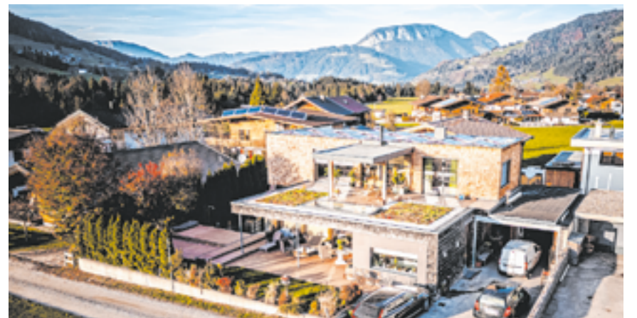
Die beiden Bauteile aus unterschiedlichen Jahrzehnten ergeben ein harmonisches Ganzes.